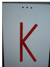
Besetzte Kontrolle (Stempel)