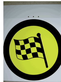
Vorankündigung Ziel SZP