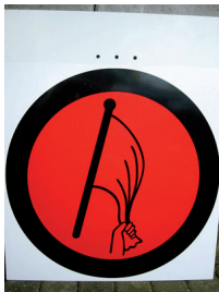
Start und Start SZP