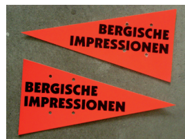
Richtungspfeile auf der SZP und Umleitungen